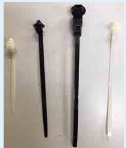
ミジエック社製品

私は、シニアのソフトボールチームに入って、毎週日曜日に2時間ほど練習し、汗を流しています。年に6回程、他のシ