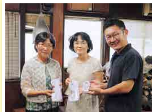
(左から)北川副会長 玉越女性委員長 大円工業松山社長