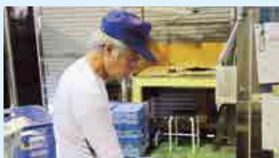
オペレーター補助作業