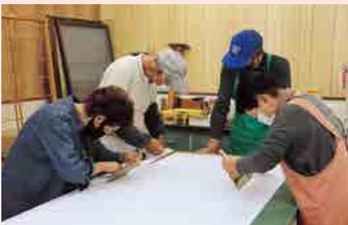
障子・網戸張替講習会の様子