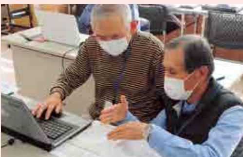
パソコン講習会の様子

11月17日（火）に障子・網戸張替講習会を開催し、会員11名が参加しました。参加者からは、「ここで習った経験を自宅で活用したい」とのお声をいただきました。