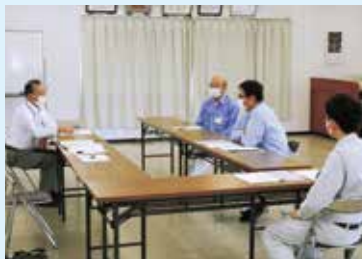
取材を受ける大矢会員

決められた仕事をきっちりやるよう心掛けています。また、社内の移動が多いため、つまづきなどのケガには注意しています。屋外作業もあるため、熱中症などにならぬよう体調管理には、十分気を付けています。会社の方も大変気遣っていただいております。なるべく迷惑がからぬよう心掛けています。