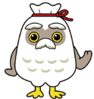
シルバー人材センター マスコットキャラクター 『チエブクロー』