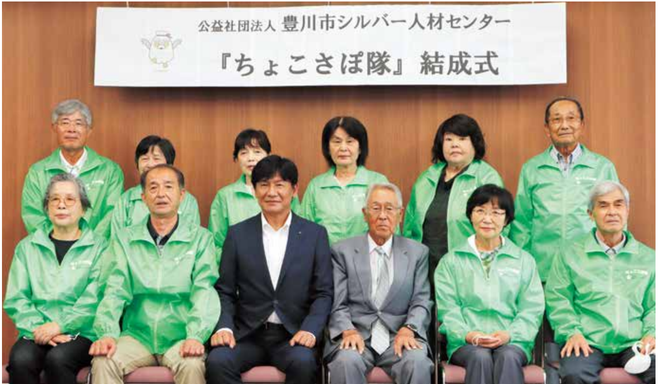
▲「ちょこさぼ隊」結成式