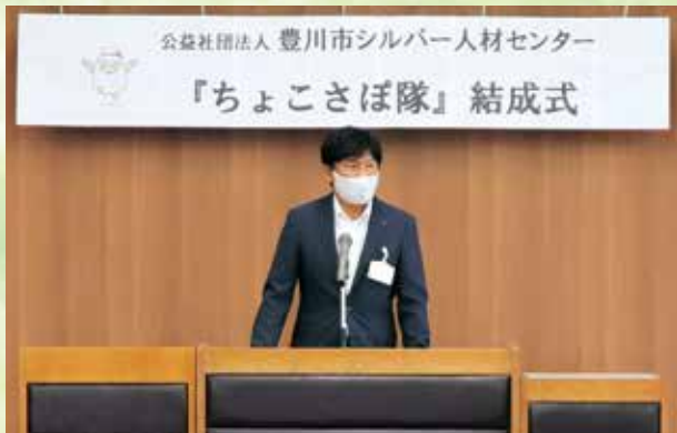
豊川市長あいさつ

令和3年7月1日（木）に豊川市長をお招きし、豊川市役所で『ちょこさぼ隊』結成式を開催しました。当日は、各中学校区の代表者10名の隊員が参加し、会長から任命書の授与、市長から携行品の授与が行われました。