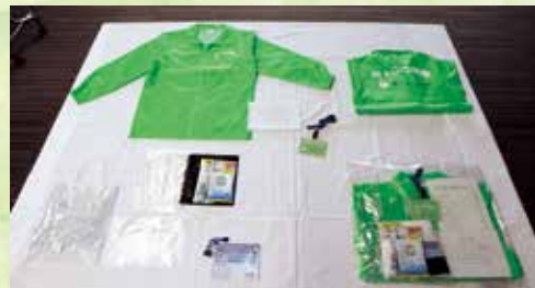
ちょこさぼ携行品