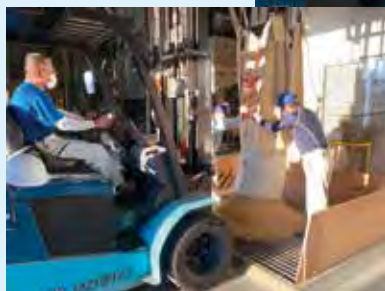
作業中の林会員と梶間会員