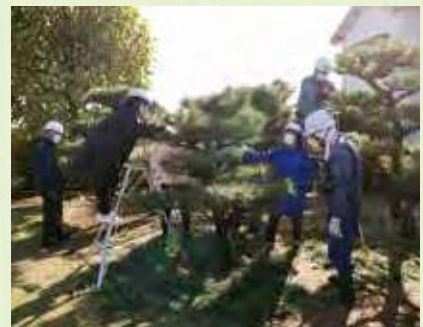
剪定会員養成講習会の様子