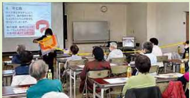
女性のための健康教室の様子

今年度も多くの会員の皆様にご参加いただきありがとうございました。 次年度も魅力的な講習会を企画していきますので、是非ともご参加ください。