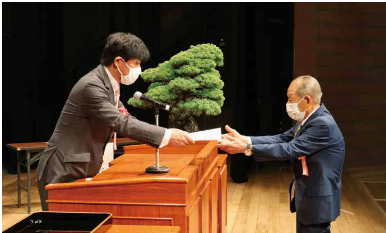
▲「竹本市長から感謝状を授与される植手会員」(40周年記念式典にて)