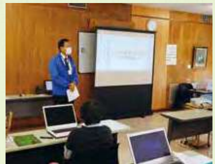
パソコン講習会の様子