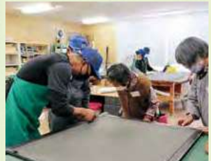
障子・網戸張替講習会の様子