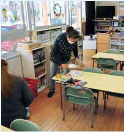
児童の受け入れ準備作業

当センターでは、豊川市から放課後児童クラブの保育補助のお仕事を引き受けています。今回は、豊川市子育て支援課のご担当者様と舟橋会員にお話を伺いました。ご担当者様からお話を伺いました。 ◎ シルバーに仕事を依頼するきっかけは？ 保護者の共働きが増えることに伴い、児童クラブの入所希望者も増加しています。そのため、児童クラブを運営する人手を必要としていました。そういった背景もあり、シルバー人材センターに依頼をするこ とになりました。 ◎ シルバーセンターの印象は？ シルバーさんは、児童への対応にも慣れており、見守りだけでなく、一緒に外で遊んでくれたり柔軟に対応していただけるので、大変助かっています。今後も夏休み等に人手が必要となりますので、より多くの方 に来ていただきたいです。