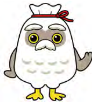
シルバー人材センター マスコットキャラクター 『チエブクロー』