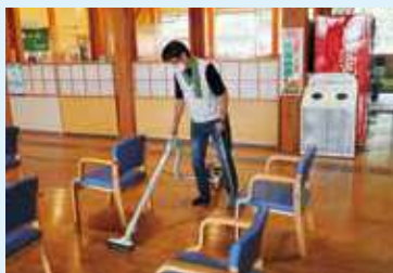
作業中の湯浅会員