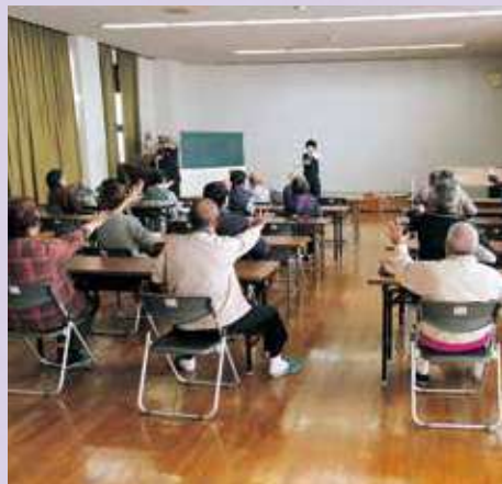
◇地区懇談会の様子