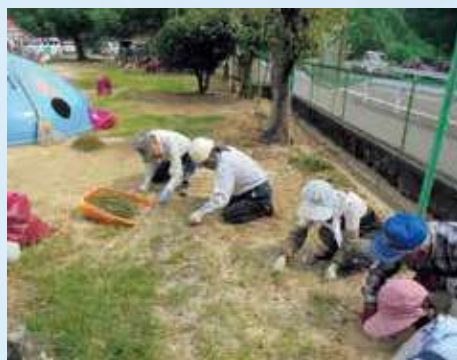
◇地区ボランティア活動の様子