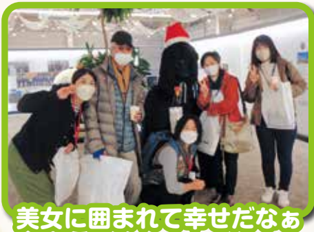
美女に囲まれて幸せだなあ