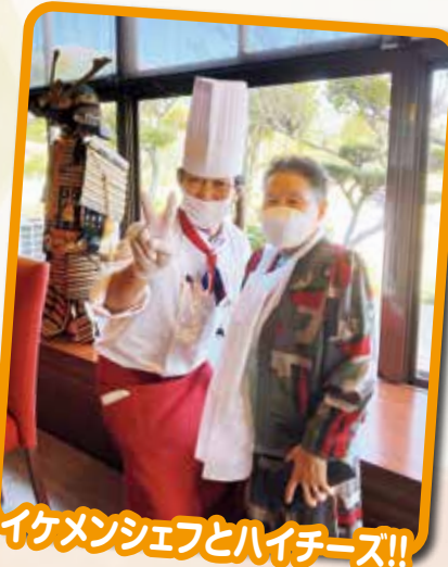
イケメンシェフとハイチーズ!!