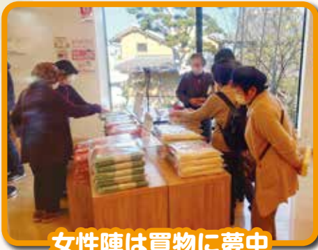
女性陣は買物に夢中