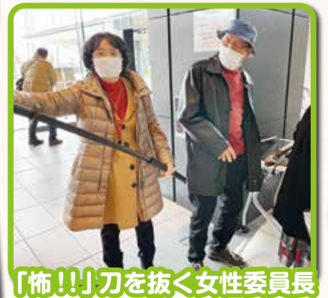
「怖!!」刀を抜く女性委員長