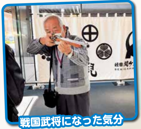
戦国武将になった気分