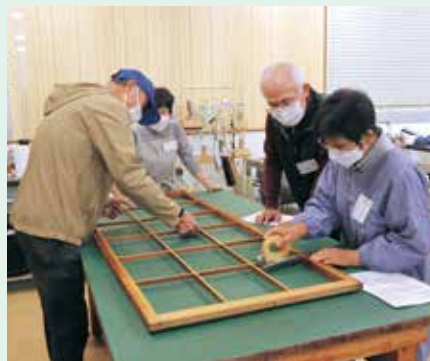
障子・網戸張替講習会の様子