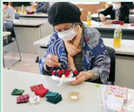
クリスマスリース講習会の様子

多くの会員の方にご参加いただきありがとうございました。 今後も定期的開催していきますので、是非ともご参加ください。