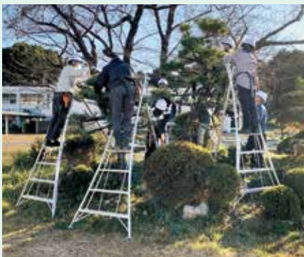
剪定会員養成講習会の様子