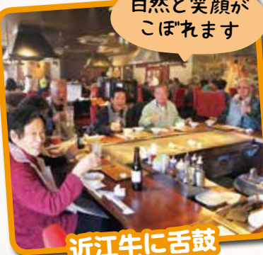
自然と笑顔がこぼれます