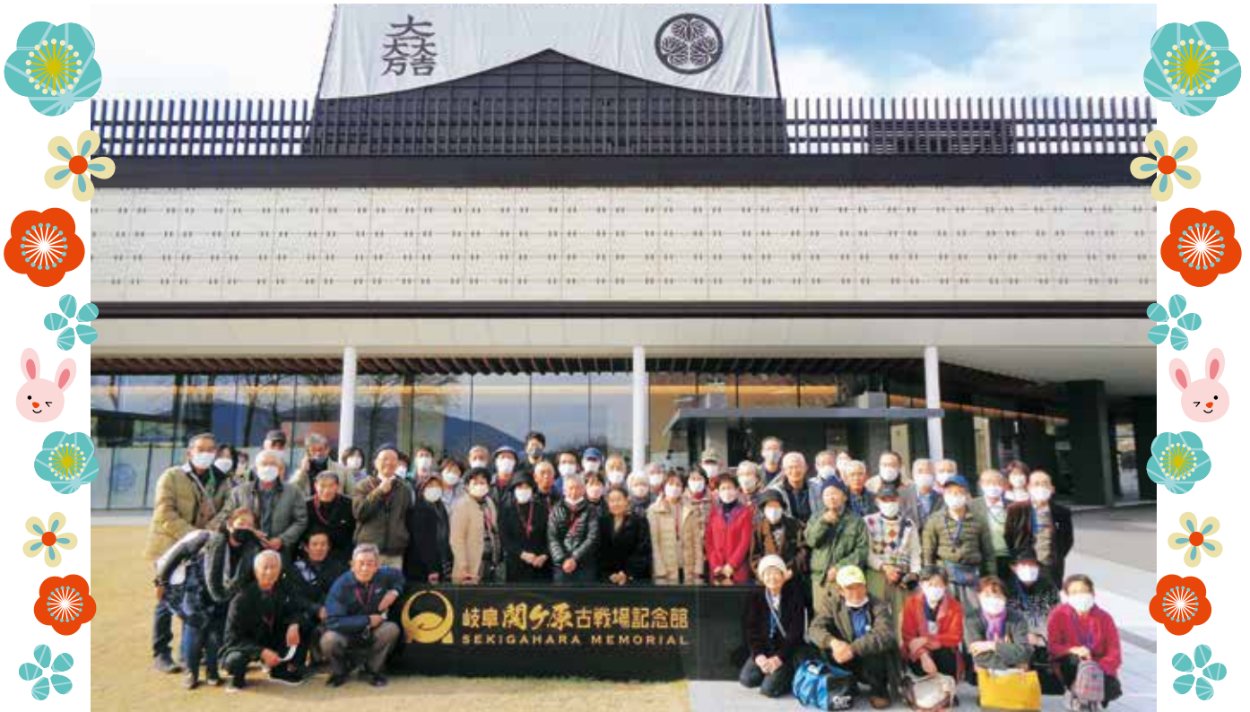
▲ 令和4年度会員親睦旅行の様子