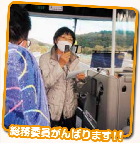
総務委員がんばります!!