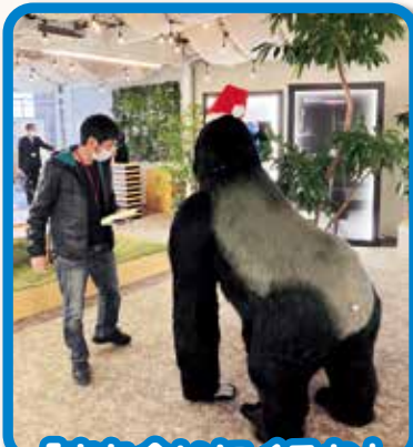
「また会いにくるね」