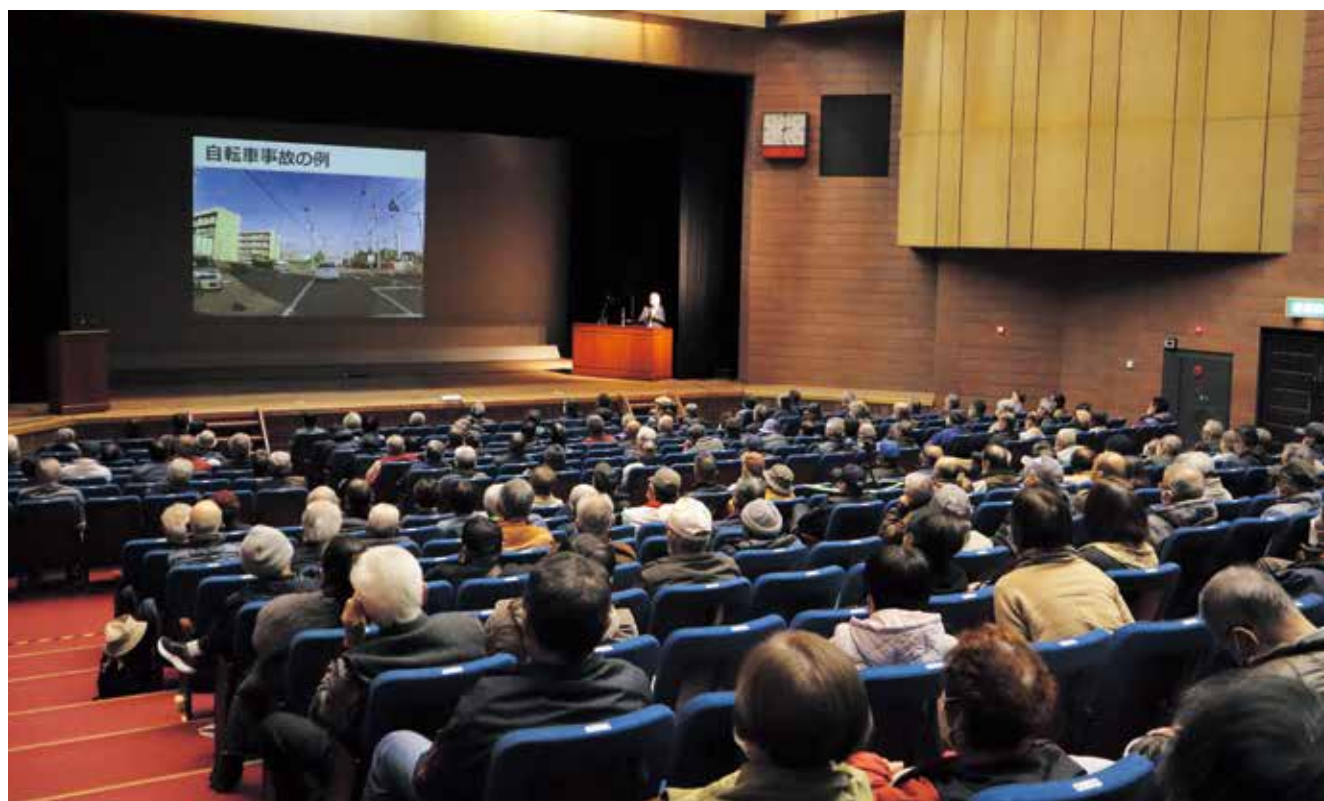
▲令和4年度会員研修会の様子