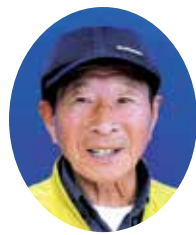
小坂井地区 藤牧会員

豊川市制施行80周年を記念して、令和5年度発行の会報全4回にわたり、今年80歳を迎える元気な会員に、それぞれの健康法についてインタビューを行います。