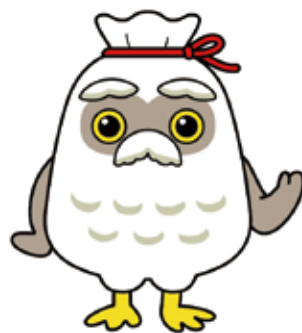
シルバー人材センター マスコットキャラクター 『チエブクロー』