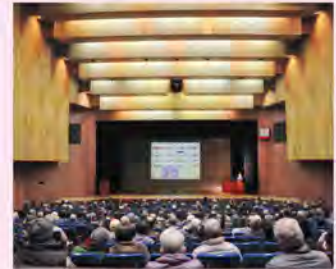
令和4年度研修会の様子