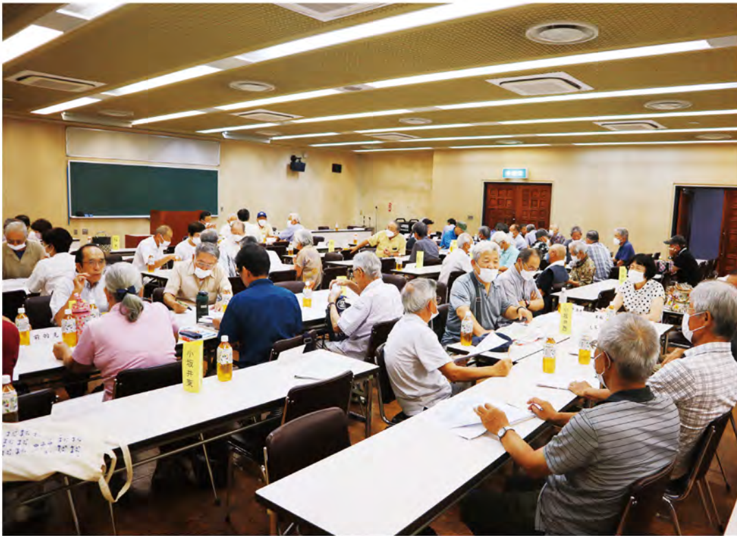
▲令和5年度地区委員・地区世話人合同会議の様子