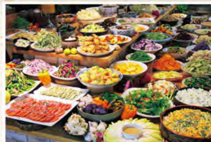
地元の食材を使った自然派バイキング昼食をお楽しみください。