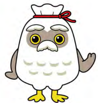
シルバー人材センター マスコットキャラクター 「チエブクロー」