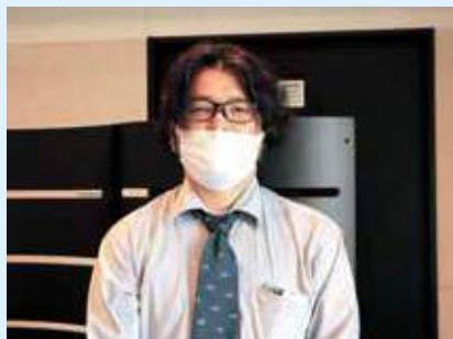
可知病院 今泉事務局次長