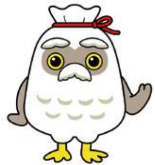
シルバー人材センター マスコットキャラクター 『チエブクロー』