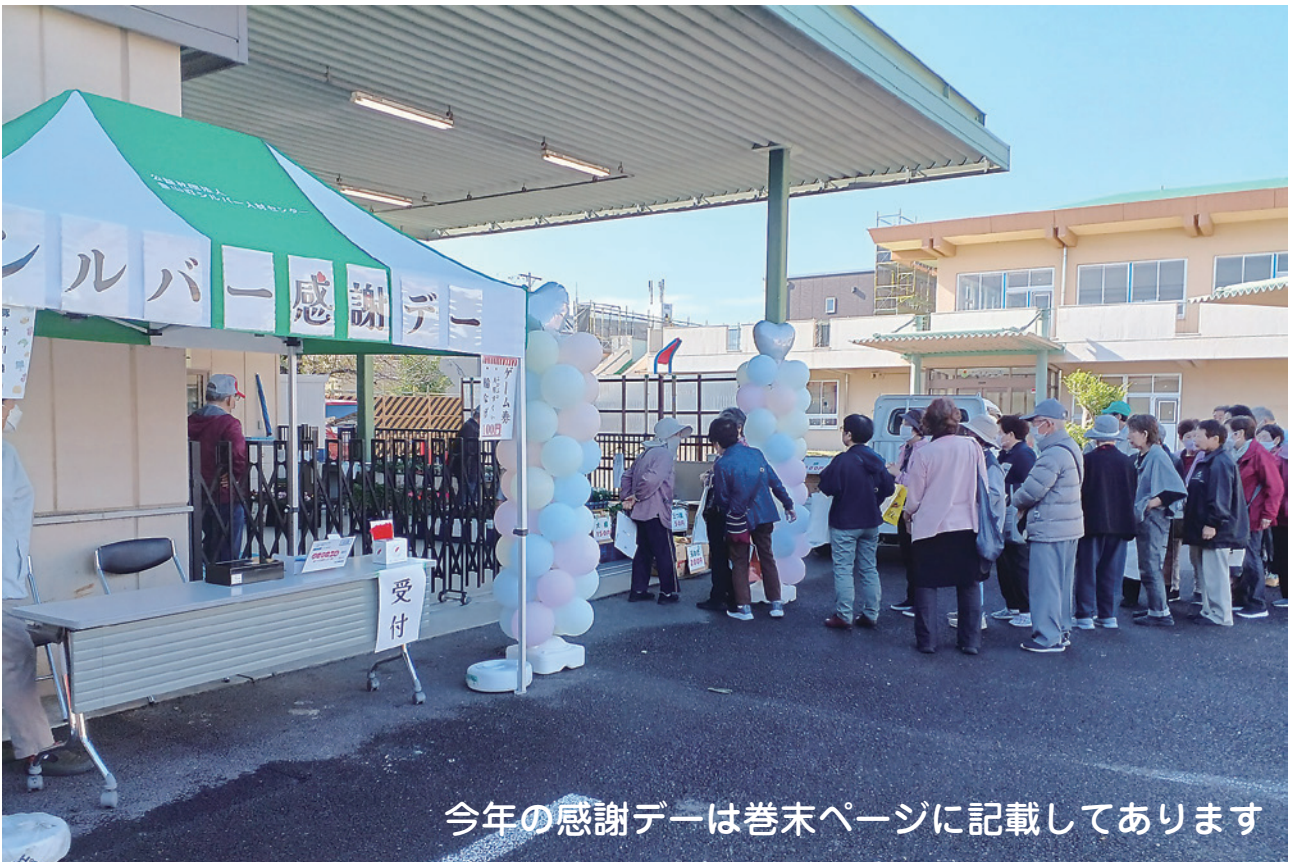
今年の感謝デーは巻末ページに記載してあります

タイトルをリニューアルしました。題字と町の花サザンカを切り絵で表現しています。作:小谷精鋭(日本きりえ協会会員) 幼少期を豊山町で過ごす