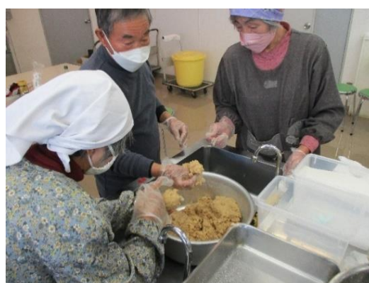
女性委員会 味噌作り教室