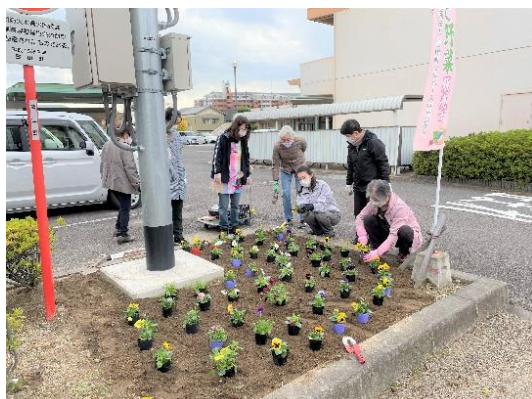
南館ひまわり 花壇花植え