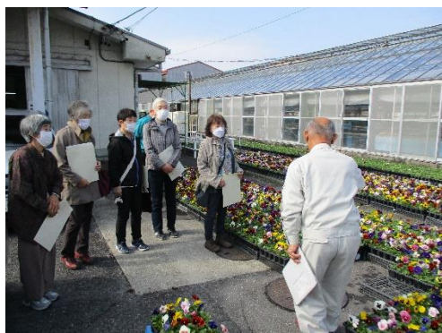
女性委員による小牧市みどりの里見学