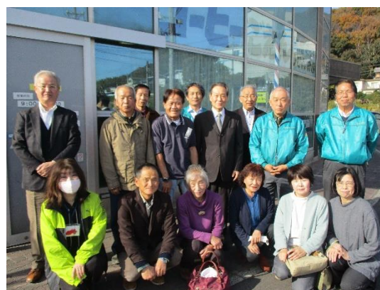
指定管理施設 「西尾市歴史公園 旧近衛邸」 独自事業「食事処 ごえん」にて 視察研修先：西尾市シルバー人材センター