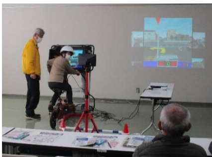
高齢者自転車教室

刈払機安全使用、樹木剪定、交通安全、スマホ教室 指定管理施設防火避難訓練、AED取扱い講習