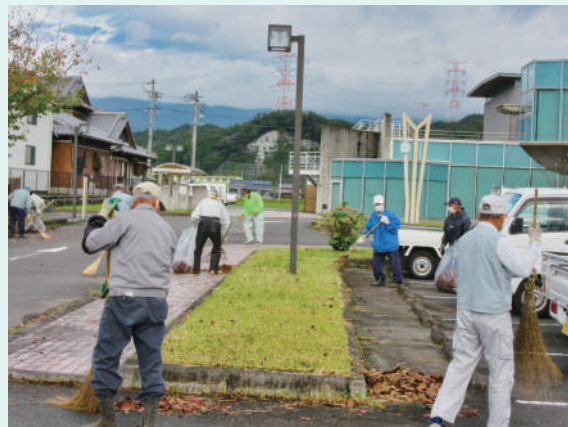
昨年のシルバーの日活動風景