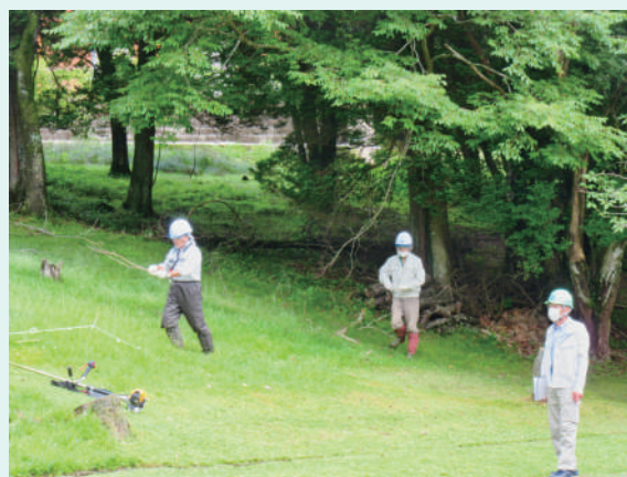
令和3年6月25日のパトロール