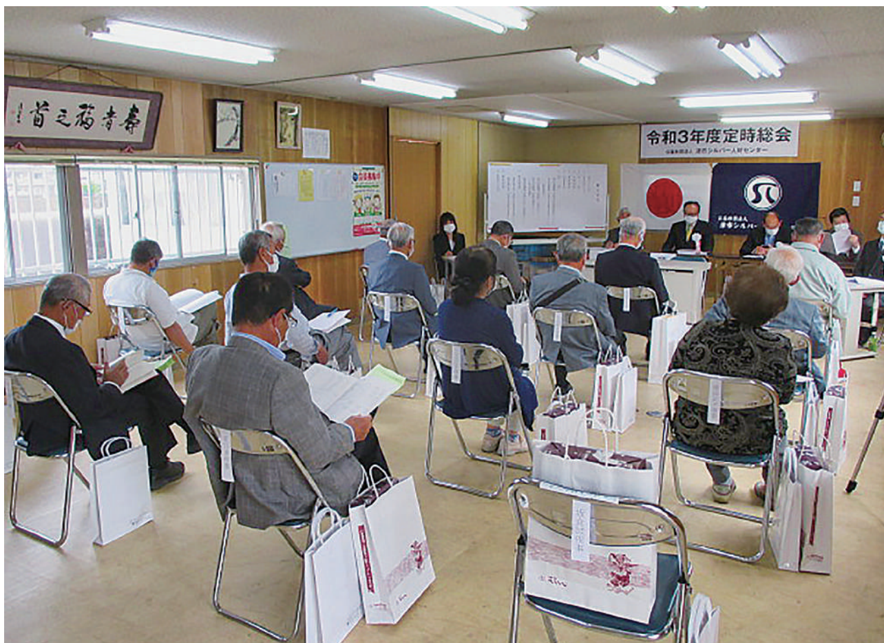
令和3年度定時総会