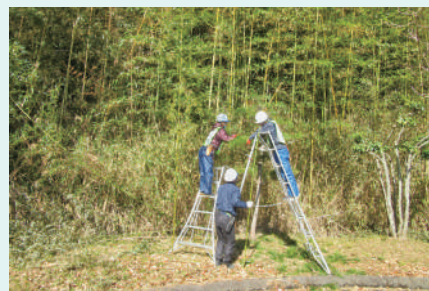
令和3年2月17日の講習会風景