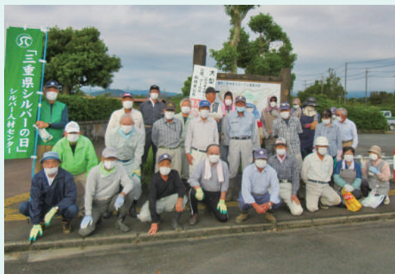
久居中央スポーツ公園