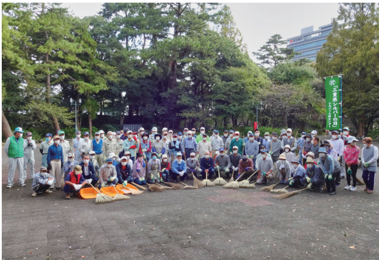
シルバーの日【お城公園】