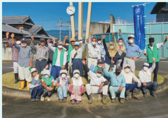
白山保健福祉センター