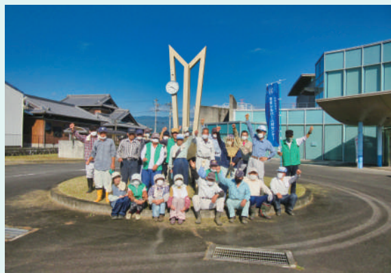
白山保健福祉センター