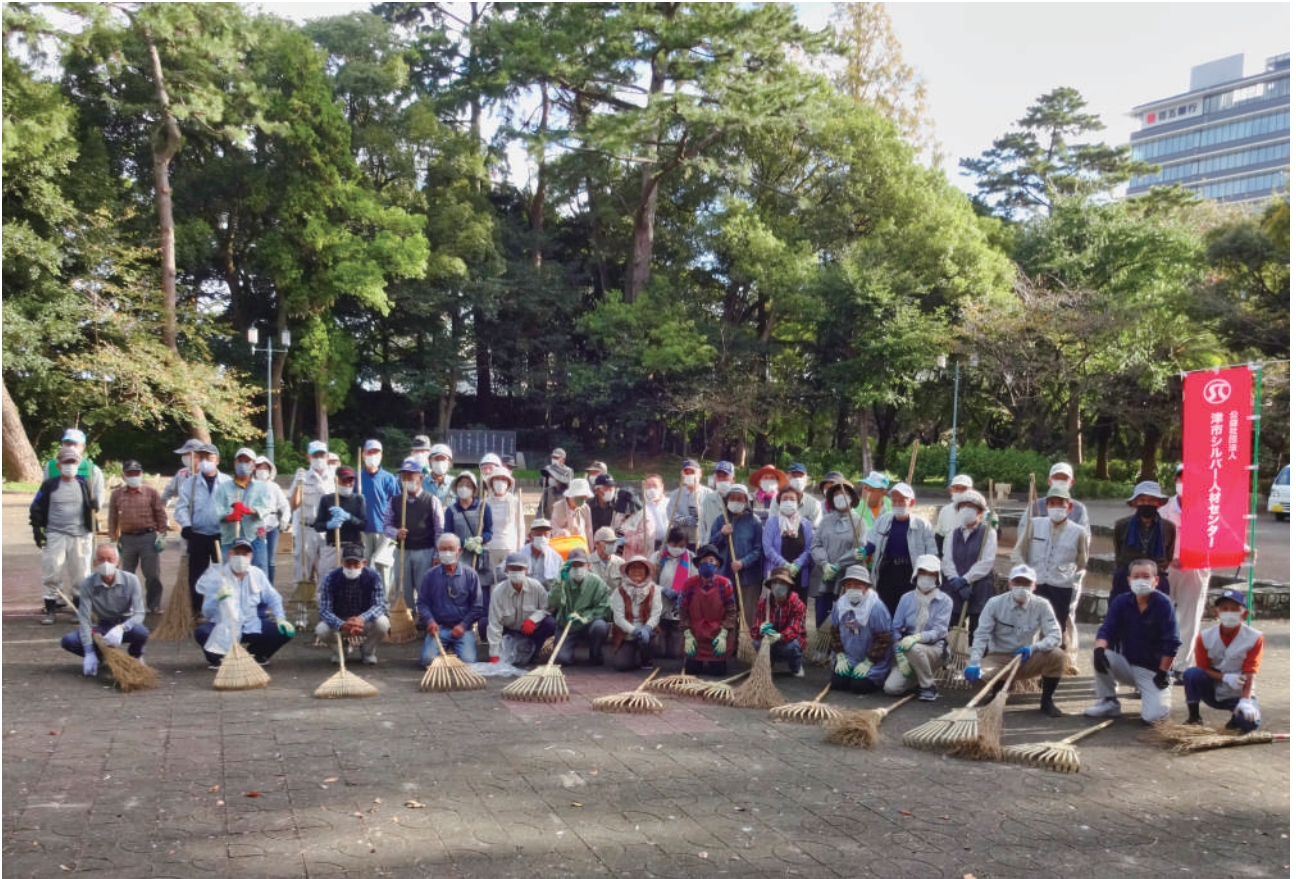
シルバーの日【お城公園】