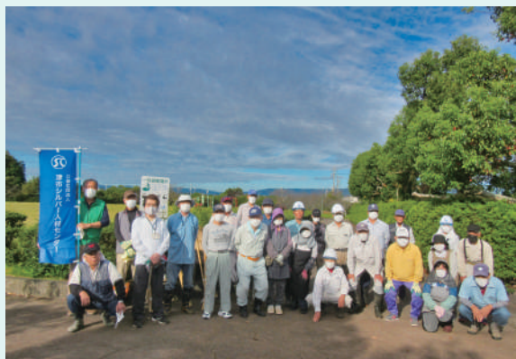
久居中央スポーツ公園