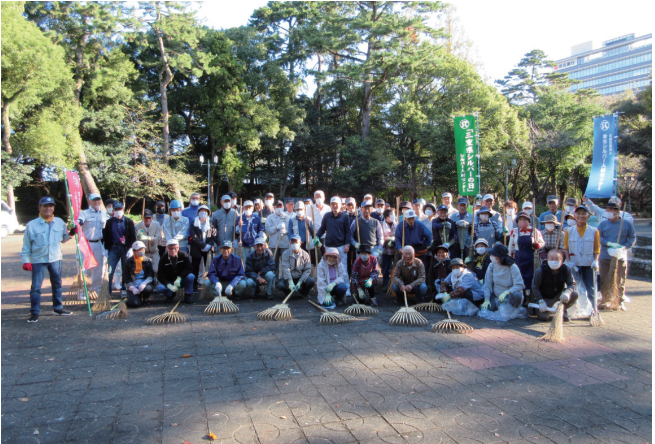
シルバーの日【お城公園】