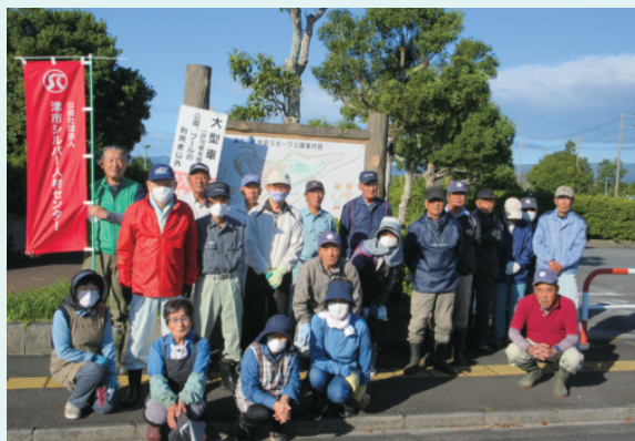
久居中央スポーツ公園