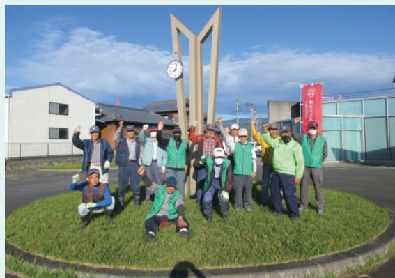
白山保健福祉センター