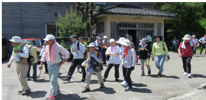
折り返し点の再出発