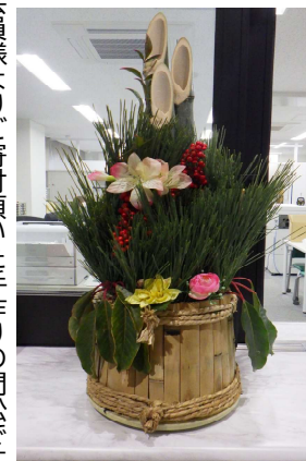
会員様よりご寄付頂いた手作りの門松です。