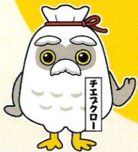
シルバー公式ゆるキャラ チエブクロー

※今回の「年会費無料」は 1/1～3/31までに入会手続きを された方で、令和7年度年会費が 対象となります。 令和8年度以降は 通常通り年会費(3,000円)が発生 しますので、予めご了承ください。