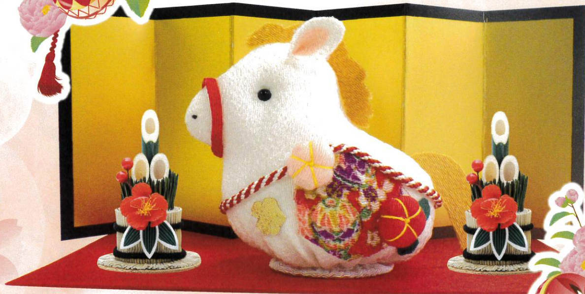
「ちりめん干支・午飾り」