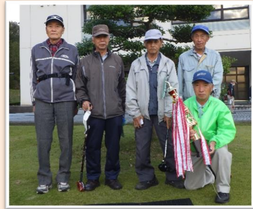
団体優勝(桜チーム)