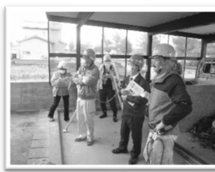
(石川県シルバー人材センター連合会 合同安全パトロール)