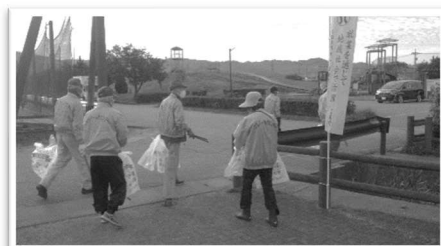
(清掃ボランティア)