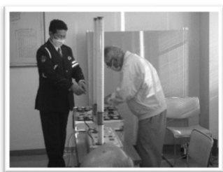
(高齢者交通安全講習会)