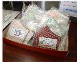
販売価格 200円（1枚） （※数量に限り有り）