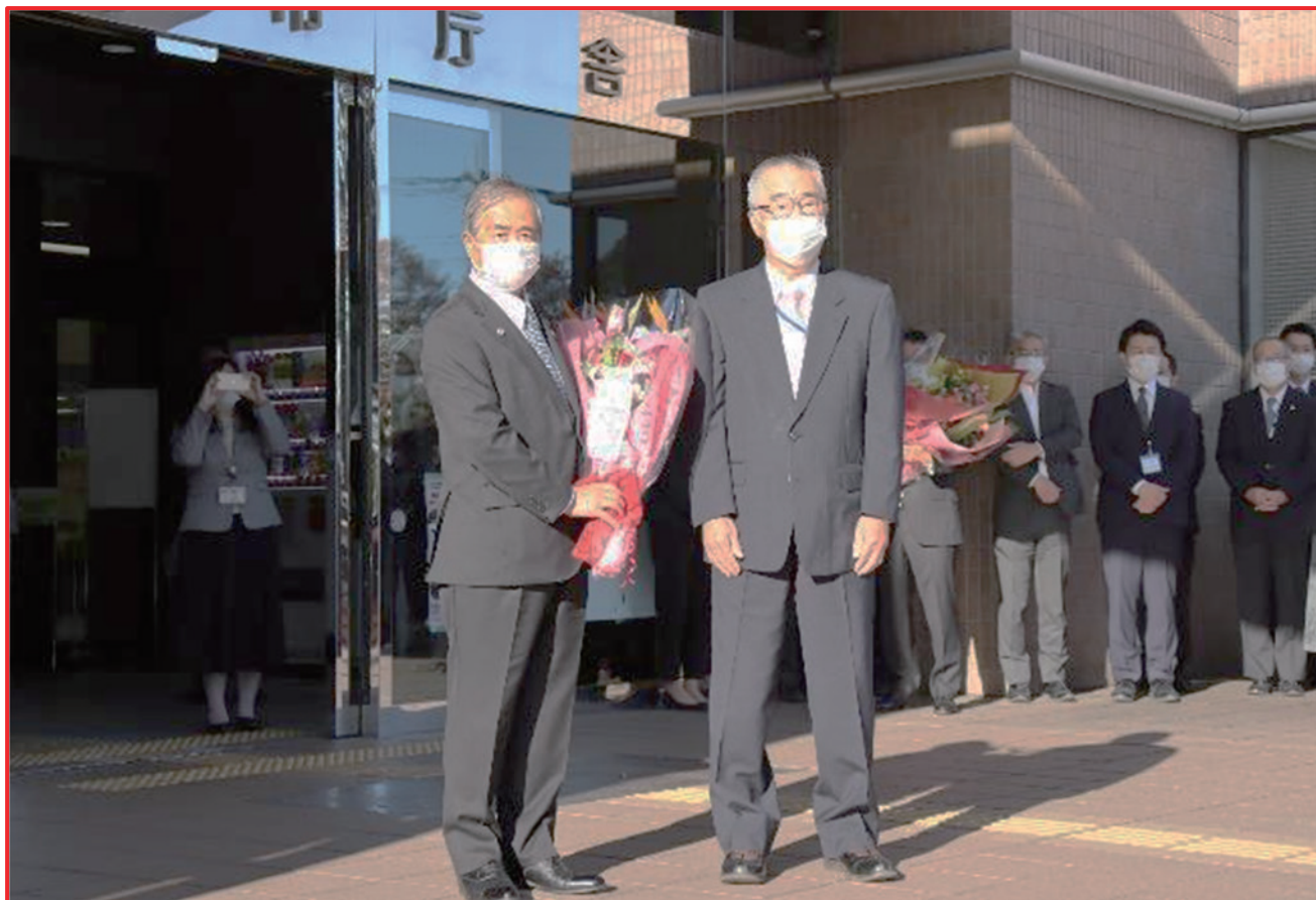
中田理事長より齊藤鶴ヶ島市長再選を祝し花束贈呈