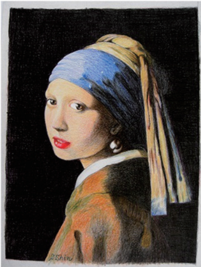
今春のコンクールに良い知らせがあることを願っております。 作品は フェルメールの「真珠の耳飾りの少女」の模写です

これまで描画の経験は皆無で1作品仕上げるのに1日3時間約40日間程書き進め、数色の色を重ねての色表現や色鉛筆の運び方、力の入れ具合などマニュアルはなく、独学この事ですが現役時代の「色屋」の経験が役立つているようです。