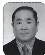
副会長 安全委員会委員長