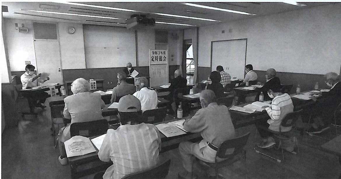
総会は、新旧役員のみ出席で開催。津島市総合保健福祉センター会議室で

令和3年度定時総会が6月1日午後2時から津島市総合保健福祉センター第1会議室で開催されました。