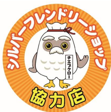
協力店ステッカー