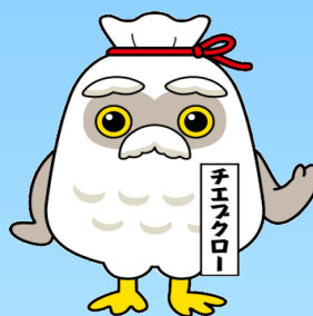
シルバーイメージキャラクター 「チエブクロー」