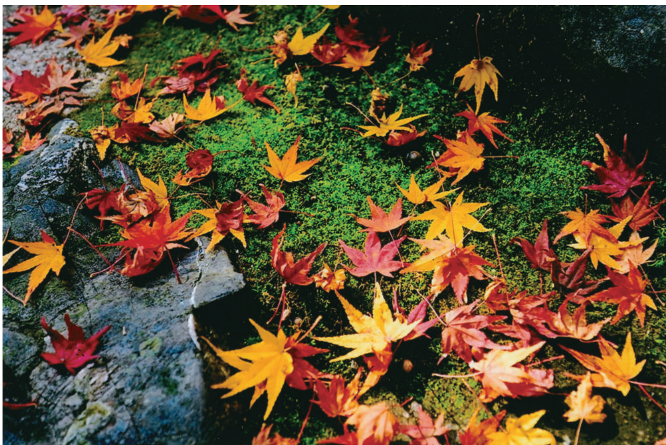
タイトル/秋を彩る