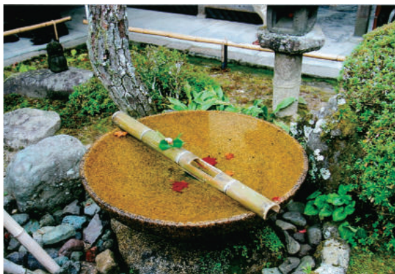
「手水鉢」 琴芝地区 井 上 ヒロミ