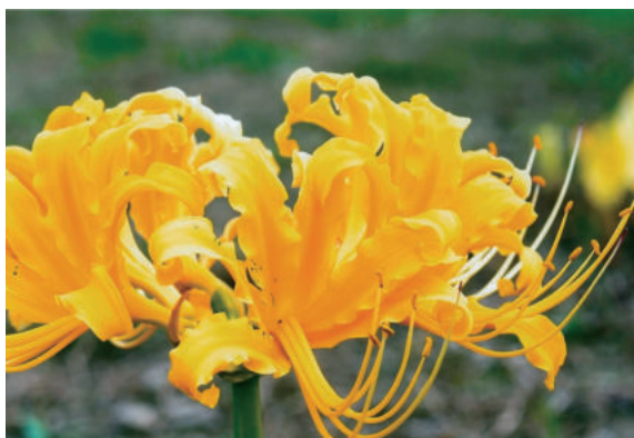
「思いやりの心」 琴芝地区 井 上 ヒロミ