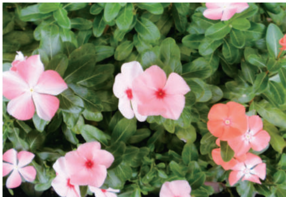
「インパチェンス」 神原地区 江 嶋 亜企雄