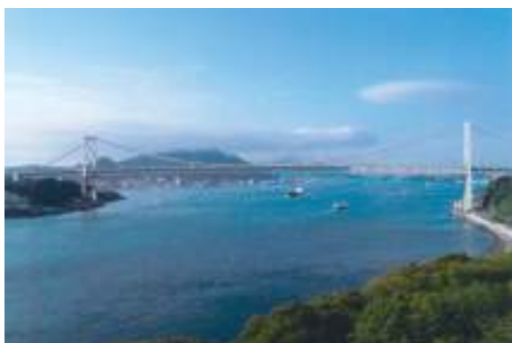
「海峡」 神原地区 江嶋 亜企雄