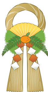
岬地区 宇野 典彦