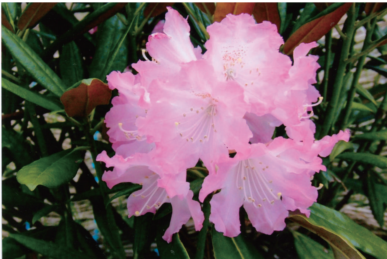
タイトル/シャクナゲ