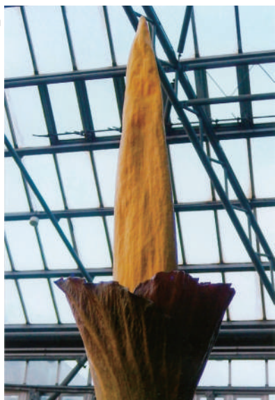
「こんにやくの花 (アマモルフオファルスデカスシルベア)」 琴芝地区 井上 ヒロミ