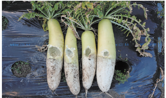
「カラスのお仕事」 上宇部地区 P.N.ぐっち