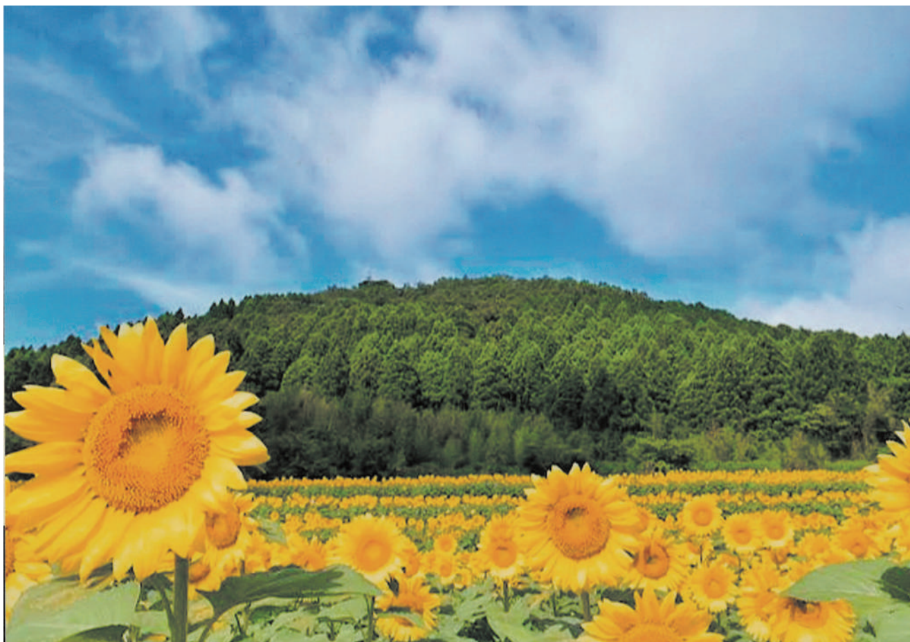
タイトル/ひまわりロード