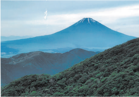
「初夏の富士山」 万倉地区 伊藤 勇