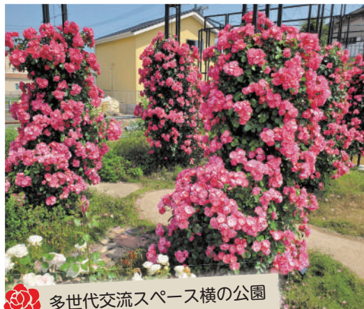
多世代交流スペース横の公園

その後、我が家の庭にもバラを!!と、始めたのです。今では狭小な庭だけでは物足りず、隣の