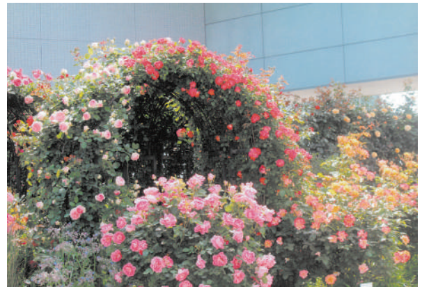
「春の香りのバラのアーチ」 常盤地区 成重 元規