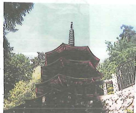
安楽寺木造八角三層塔

※ エンジョイライフ季刊情報誌 vol. 99号「ゆとりっち」東信版より一部転載