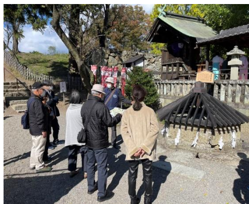
10期生の常駐ガイドデビュー!(10/23)