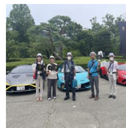
おもてなし武將隊、「真田丸テーマ曲」の生演奏、そして私たちも旗とうちわを振りながらお出迎えました。

旅行の楽しみ方が多様化していく現在、私たちガイドは、お客様に満足して頂けるようしっかりと準備をして臨みましょう。そして、笑顔で感謝の気持ちで謙虚に接することが大切です。(ガイド十則より引用)