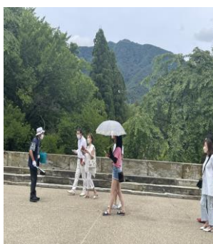
熱心に案内を聞いてくださるお客様たちでした。

全国各地からランボルギーニ40数台が来てくださり、上田城は大いに賑わいました。 ガイド10人が、午前午後で、60人ものお客様にご案内を致しました。