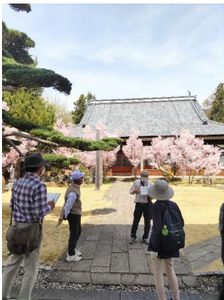
当日は、桜が満開の大輪寺

約7kmの行程、汗ばむ陽気で疲れも感じましたが、あちこちで満開の桜が私達を迎えてくれました。癒やされながら勉強できました。🌸