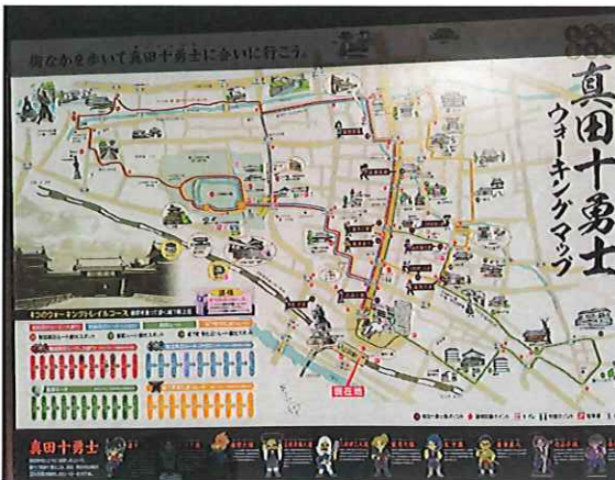
ウォーキングマップを利用して コースの説明