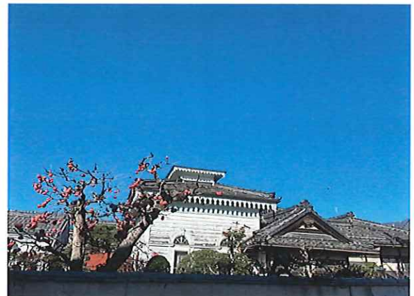
和洋折衷の珍しい作りの建物