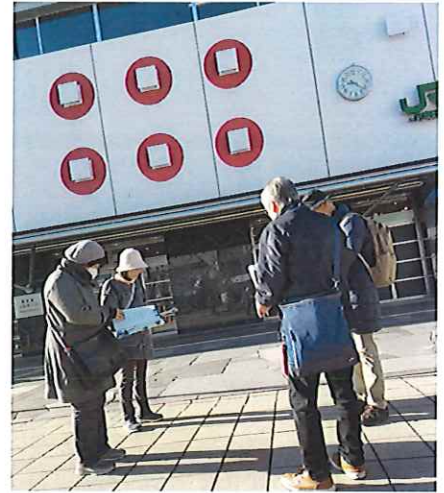
スタートは上田駅前

上田駅観光案内所~真田幸村公像~願行寺~月窓寺~大輪寺~海禅寺~柳町~芳泉寺~歴史の散歩道~上田城 (お客様の要望に沿って、アレンジは可能) この研修がいつか役立つことでしょう。