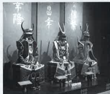
特別展「400年の時を経て甦る上田城」

好評のうちに幕を閉じた大河ドラマ「真田丸」。その興奮が冷めやらぬ今年4月からドラマ館を改装し、開館した「 400年の時を経て甦る上田城 」特別企画展館にはドラマ館時には及ばぬものの5月末で38,000人を超える大勢のお客様が訪れています。真田氏ゆかりの品々を展示するこの企画展の管理をシルバーが受け、主要な部分を観光ガイド班が担当しています。ドラマ終了の翌年は観光客の減少とともにガイドの仕事も大幅にダウンするのではないかと危惧していたガイド班ですが、この企画展の