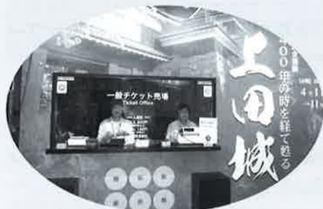
チケット販売は会員が担当しています

開催によりガイド本業ではないにせよ真田丸関連業務として、今年11月30日までは会場の入場・受付、会場整理などの仕事に携わっていきます。