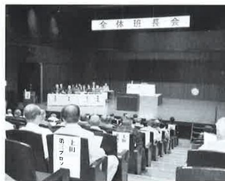
平成29年度全体班長会