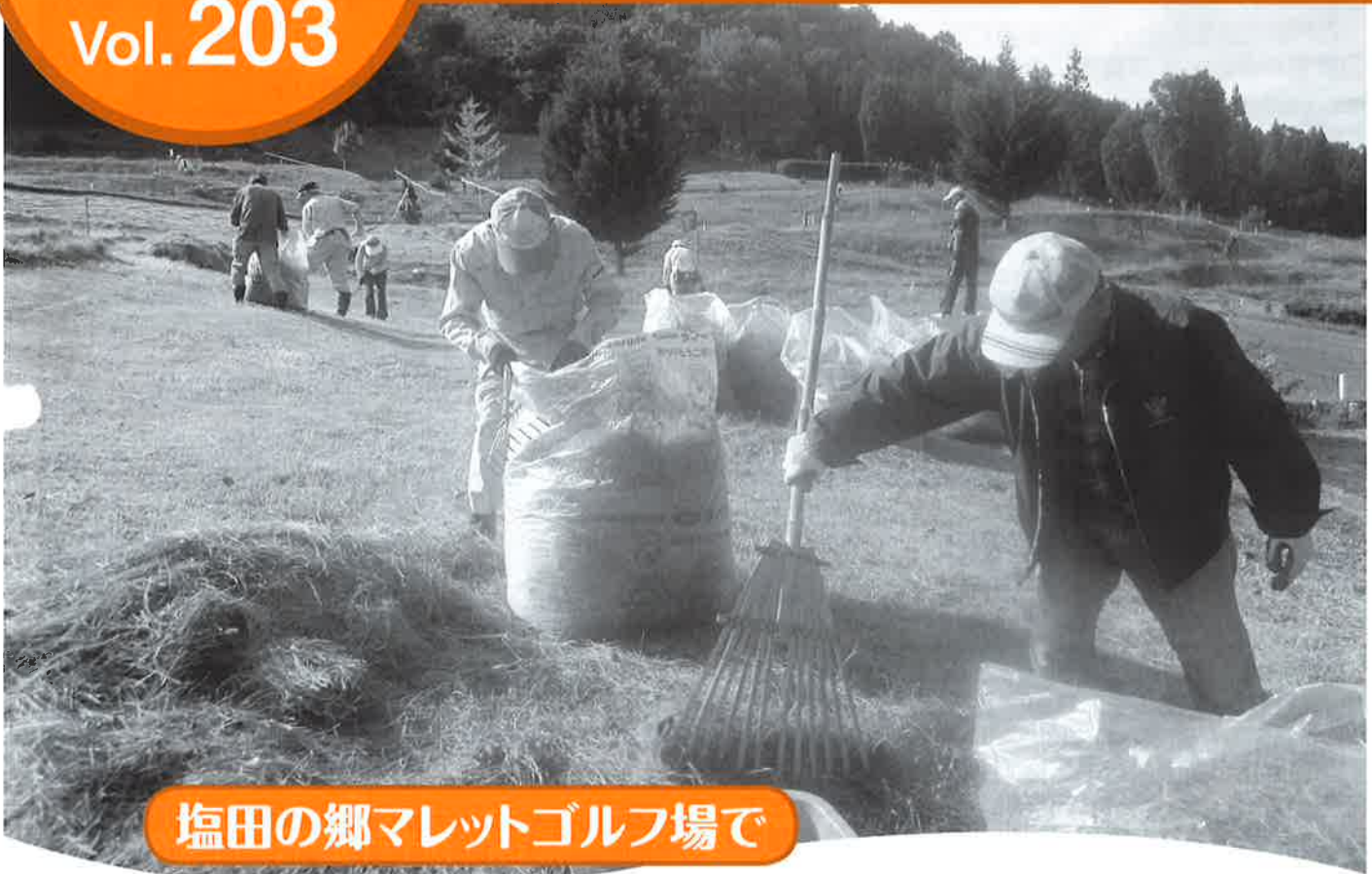
塩田の郷マレットゴルフ場で

公益社団法人上田地域シルバー人材センター 長野県上田市常磐城三丁目2番10号 TEL.(0268)23-6002 FAX.(0268)26-4828 ホームページ:http://ueda-sjc.org E-mail : uedasc@sjc.ne.jp