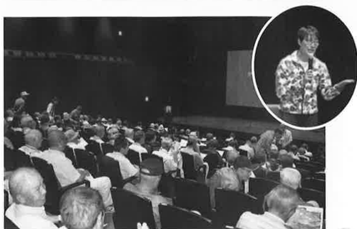
平成29年度 安全就業・交通安全講習会出席状況

その後、交通安全運転講習に移り、交通安全協会提供の啓発DVD「あなたの運転は大丈夫か?」が上映されました。DVDによる目で見る交通安全の講習で自分自身の運転を素直に見直す絶好の機会となり、大変有意義な講習会となりました。