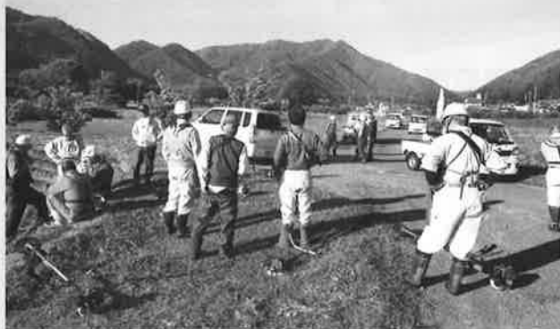
6月15日の長和地区ボランティア