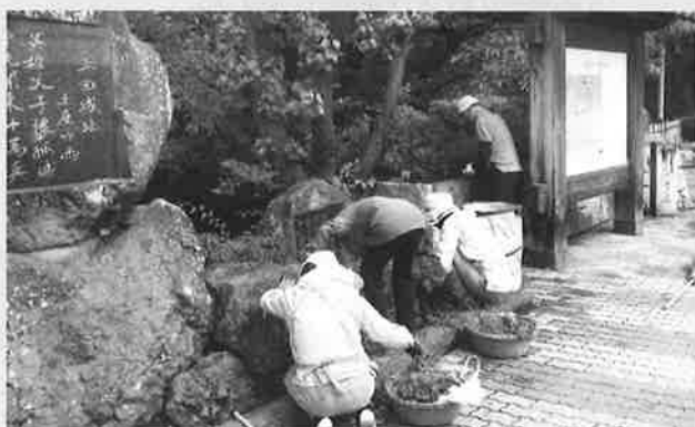
7月13日の観光ガイド班ボランティア