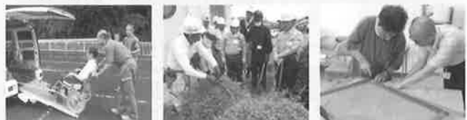
昨年度の講習会の様子