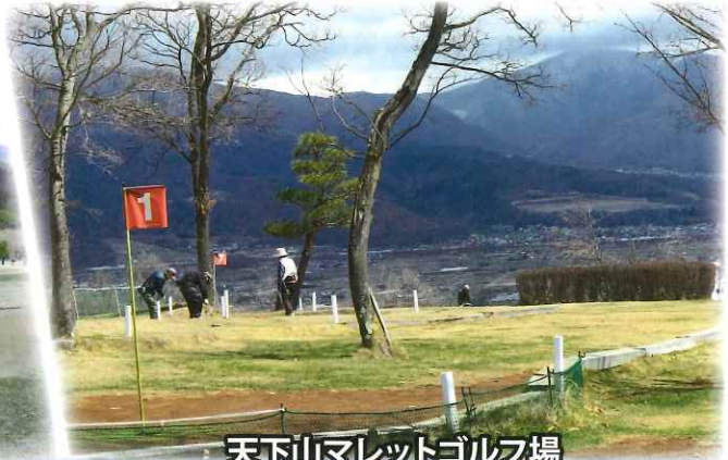
天下山マレットゴルフ場