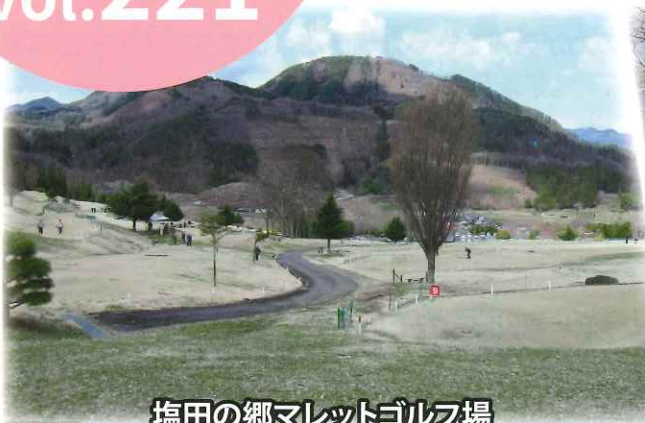
塩田の郷マレットゴルフ場