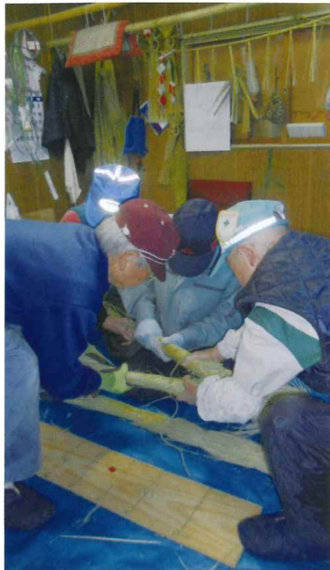
しめ飾り作り (2016年より)