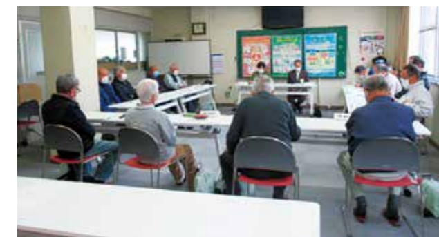
第4ブロック・青木地区 班長会

新型コロナウイルスの感染防止対策を徹底のうえ、それぞれ役員・班長会議が開催されました。