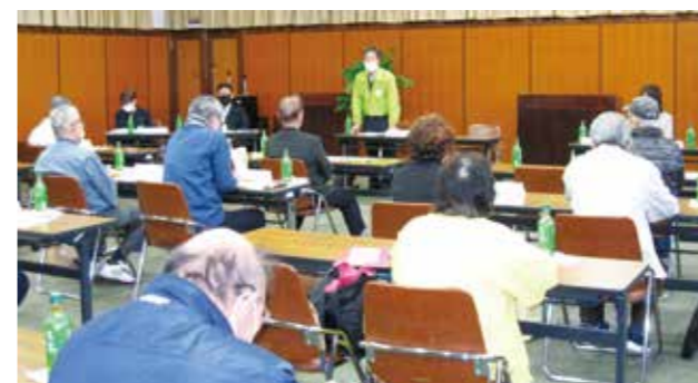
第3ブロック 班長会