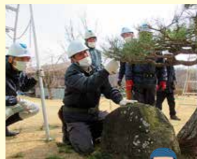
松の一葉を刈り取る

受講者は、「迷いながら剪定していたが、参加したことによって以前より自信を持って作業ができるようになった」と喜んでいました。