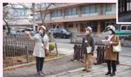
◀上田藩主館 (上田高校) 前で