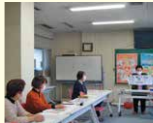
上田事務所 参加者 10人