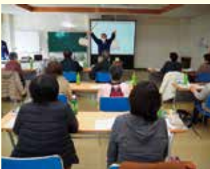
丸子公民館 参加者 18人