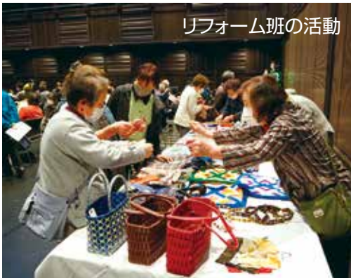
リフォーム班の活動