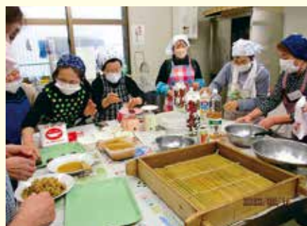
ゆきむら夢工房 参加者 12人