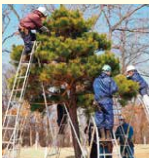
天下山マレットゴルフ場 参加者 17人