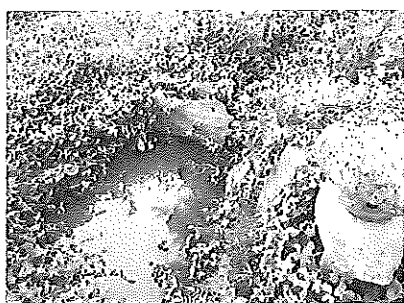
巴御前が尼僧となり身を清めるため 「お歯黒」を洗い落とした池

依田城跡、義仲の館跡、義仲が戦勝祈願をした岩谷堂観音の義仲桜、そして義仲公に仕える女性武者巴御前のお歯黒の池等、義仲にまつわる史跡が多く存在しています。上田市が発行しているマップを見て散策してみるのはいかがでしょうか。