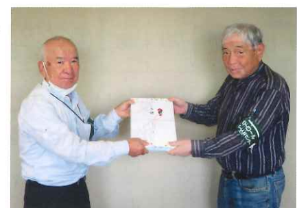
安全表彰(大場会員)