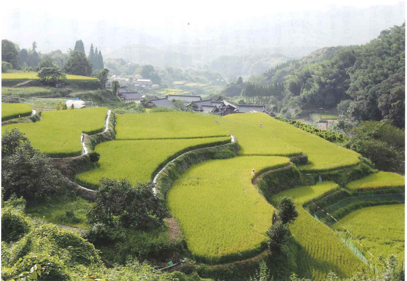
小川町棚田の風景