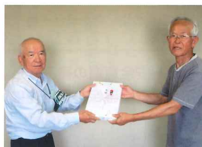
安全表彰(濱田会員)