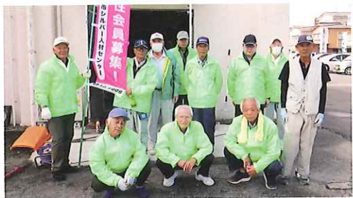
松橋・小川・豊野地区

今年度も奉仕作業を実施しました。作業は宇城市シルバー人材センター周辺、新緑館、三角東港近隣公園で剪定、除草、ごみ拾いを実施しました。41名の皆様の参加でとてもきれいになりました。皆様のご協力ありがとうございました。