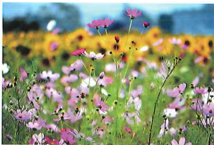
曲野秋桜 & 向日葵