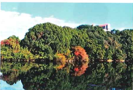
曲野猫の迫堤 (大池)