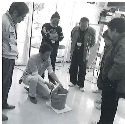
モップのしぼり方