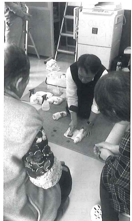
カーペットのシミ取り