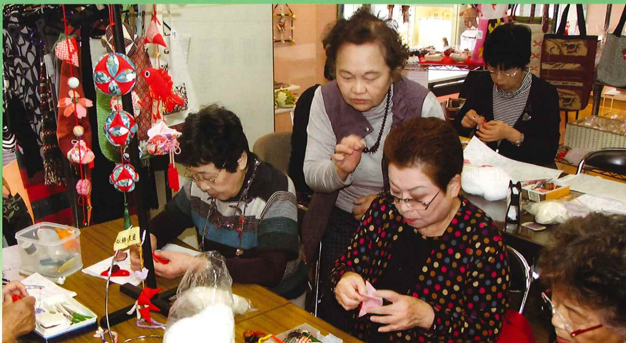
写真／【左上】試食販売 【右上】奉仕活動（河内総合福祉センター） 【下】つるし雛教室