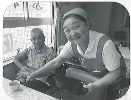
はりきり4人組！いらっしゃいませ♪