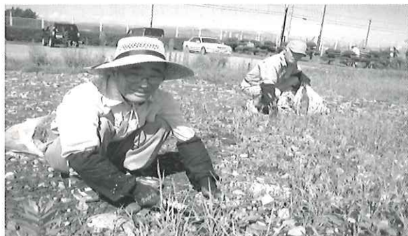
今年の夏も暑かった！

北部事業所の7月度実績は、会員数262名で16,415千円の事業実績を計上しました。 事業実績の主な内容は、除草・草刈などの屋外作業が一番で、続いて植木剪定などの技能作業となっています。 除草・草刈・植木剪定のできる方、やってみたい方は事業所まで申し出てください。