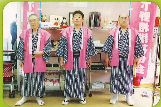
～ 5月1日「はなむすび」オープンセレモニーの様子～